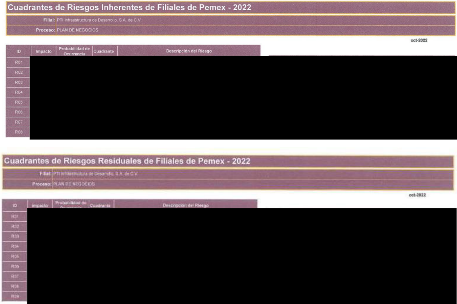
Fig. 2 Riesgos de negocio de PTI Infraestructura de Desarrollo, S.A. de C.V.

Los riesgos de negocio que se identificaron en PTI Infraestructura de Desarrollo, S.A. de C.V., se agrupan bajo los siguientes tipos y cuadrantes (Fig. 2):